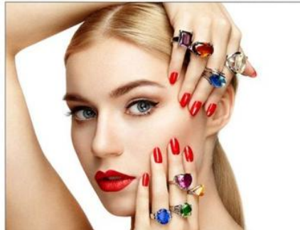
中国国际美甲美睫纹绣大赛